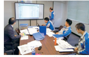
環境監査(書類審査)

ケイミューにおける環境経営の考え方の中心となっているのは「ケイミュー地球環境憲章」であり、それに基づいて「ケイミュー環境方針」を制定しています。全社および各製造事業所ではこの方針を基本に「環境自主行動計画」を定め、環境マネジメントの国際規格であるISO14001に則した継続的な改善に取り組んでいます。さらに3か年の取り組み目標を数値化した「環境推進中期計画」を年度ごとに策定し、その達成度を確認するとともにPDCAの年次レビューを行います。この内容については未達成の部分も含めて開示し、取り組み成果のスパイラルアップに努めています。