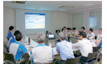
環境関連法勉強会