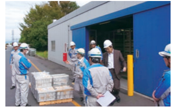
廃棄物管理監査(現場審査)

2016年9月には「改正・PCB特別措置法」「一部改正・廃棄物の処理及び清掃に関する法律」などをテーマとして勉強会を開催し各製造事業所環境担当者への法改正情報の共有化と理解を深めました。