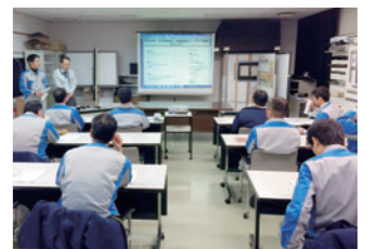
内部環境監査員研修

あり、北九州工場では新規格への移行の背景とその目的、2004年版との比較など教育機関のカリキュラムによる内部環境監査員の研修を実施し、新規格への着実な移行とその運用に万全を期し取り組んでいます。