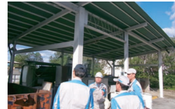
環境監査(現場審査)