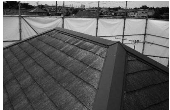
棟高までシートを設置