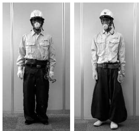
作業着の標準的な服装です