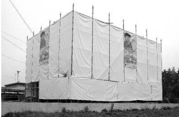
四囲に足場・シートを設置

現場での安全確保と周囲への粉じん飛散防止のために、防災シートを四囲に設置します。防災シートによる粉じん飛散対策が効果的ですので、足場業者には通常のメッシュシートではなく防災シートと発注してください。