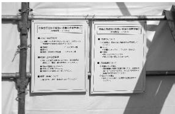
作業者への注意喚起掲示