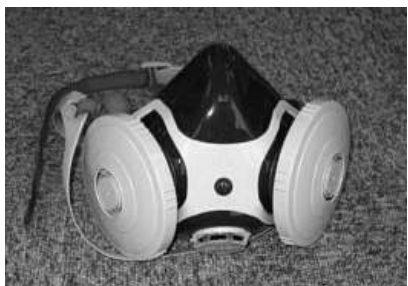
半面形防じんマスク RS2・RL2