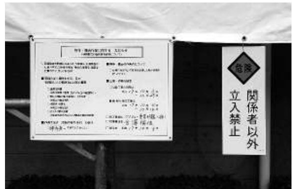
近隣へのお知らせの掲示