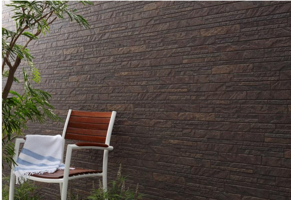
ネオロック・光セラ16 セラトピア 「グランガル」