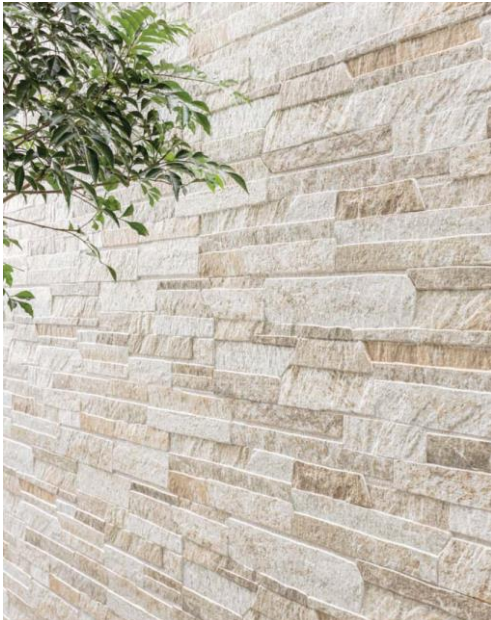
(色:インプレース チタン ブラウンN)