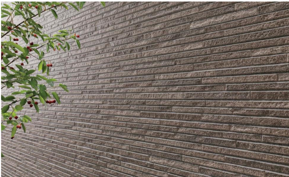
(色:QF グラート チタン ダークブラウンN)