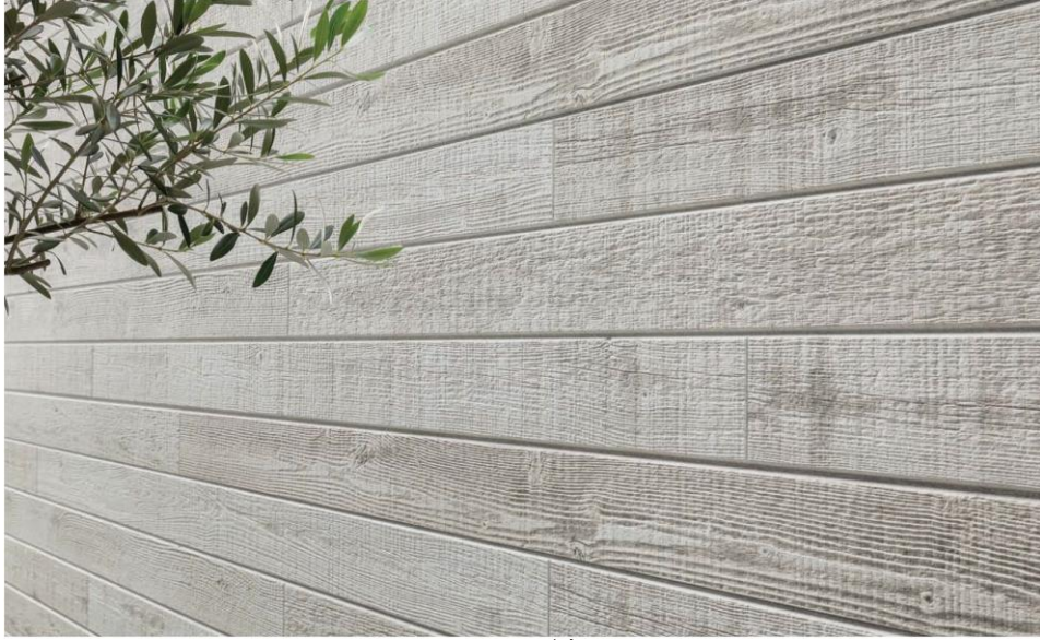
(色:QF エストレモ チタン ホワイトN)