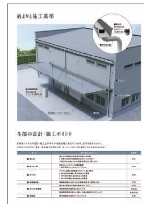
サイホン発生のポイント(施工制約)