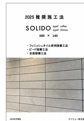
typeF 推奨施工法 (600×140)