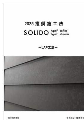
typeF 推奨施工法 (LAP工法)