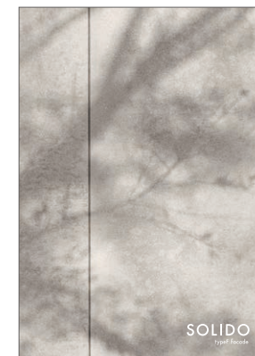
typeF facade ※ カタログ ※一般地域専用品