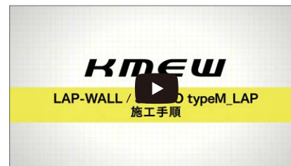
typeM_LAP施工手順 (LAP-WALL 施工手順)