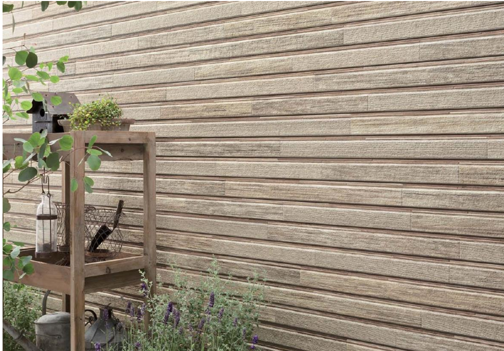
ネオロック・光セラ18セラトピア「コントラストボーダー」

住まいの外まわりを提供する、外装建材メーカーのケイミュー株式会社(本社:大阪市中央区、社長:野浦高義)では、全社のスローガンである“暮らしをまもる、住まいを魅せる”の実現に向けて、このたび窯業系サイディングのネオロック・光セラ18セラトピアシリーズに新柄を発売致します。