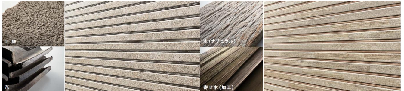
QFコントラスト チタン アース