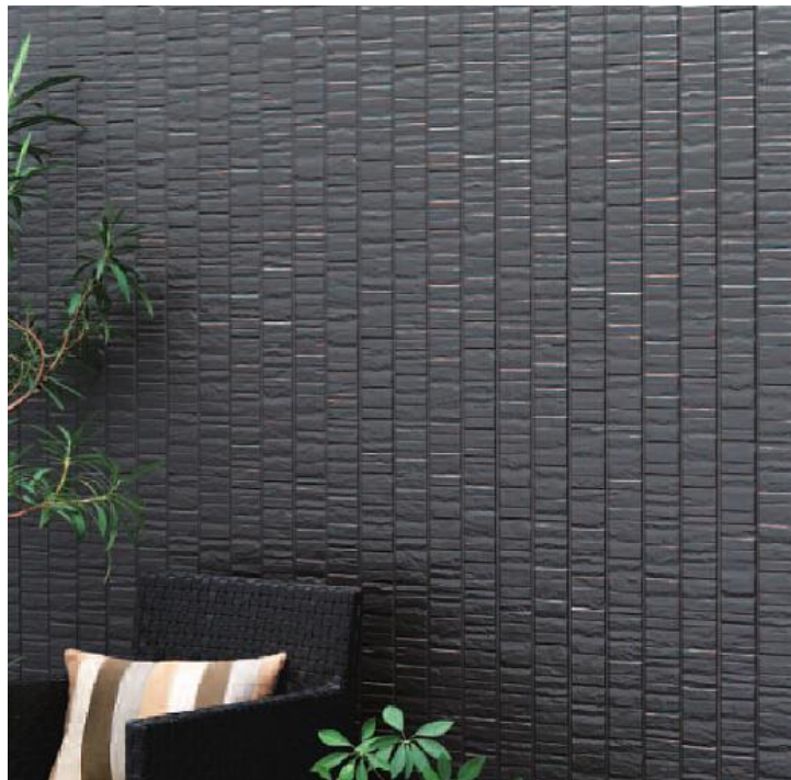
アニューシリーズ「グロッシュ」 グラングレー

住まいの外まわりを提供する、外装建材メーカーのケイミュー株式会社(本社:大阪市中央区、社長:野浦高義)では、全社のスローガンである“暮らしをまもる、住まいを魅せる”の実現に向けて、このたび金属サイディングの「はる・一番」に新シリーズ「アニューシリーズ」が誕生。シリーズの第一弾として「グロッシュ」を発売致します。