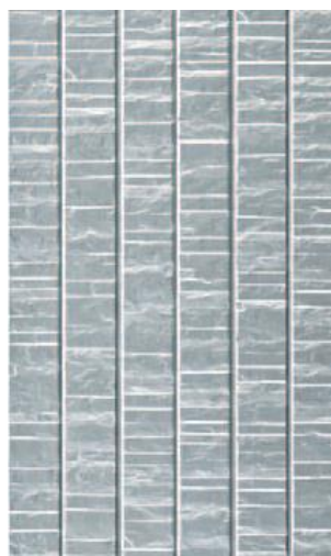
メタリックシルバー